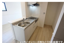
ニューライズシリーズ間タイプのお部屋です。