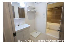
ニューライズシリーズ間タイプのお部屋です。

※写真及び図面と現況が異なる場合には現況優先とさせていただきます。 また、実際の間取りは図面と反転する場合があります。