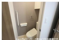
ニューライズシリーズ間タイプのお部屋です。