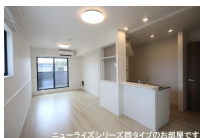
ニューライズシリーズ間タイプのお部屋です。