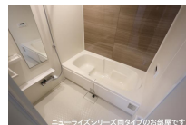
ニューライズシリーズ間タイプのお部屋です。