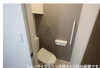
ニューライズシリーズ間取りタイプのお部屋です。