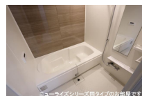
ニューライズシリーズ間取りタイプのお部屋です。