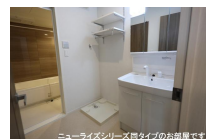
ニューライズシリーズ間取りタイプのお部屋です。

※写真及び図面と現況が異なる場合には現況優先とさせていただきます。 また、実際の間取りは図面と反転する場合があります。