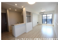
ニューライズシリーズ間取りタイプのお部屋です。