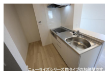
ニューライズシリーズ間取りタイプのお部屋です。