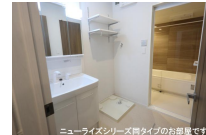
ニューライズシリーズ間タイプのお部屋です。

※写真及び図面と現況が異なる場合には現況優先とさせていただきます。 また、実際の間取りは図面と反転する場合があります。