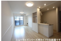
ニューライズシリーズ間タイプのお部屋です。