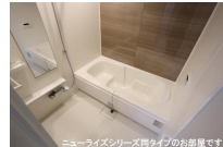
ニューライズシリーズ間タイプのお部屋です。