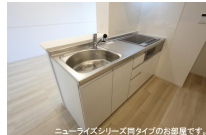
ニューライズシリーズ間タイプのお部屋です。