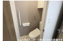
ニューライズシリーズ間タイプのお部屋です。