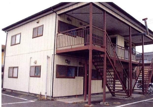
コーポ丸光・コーポ吉田・コーポ入吉田 駐車場配置図